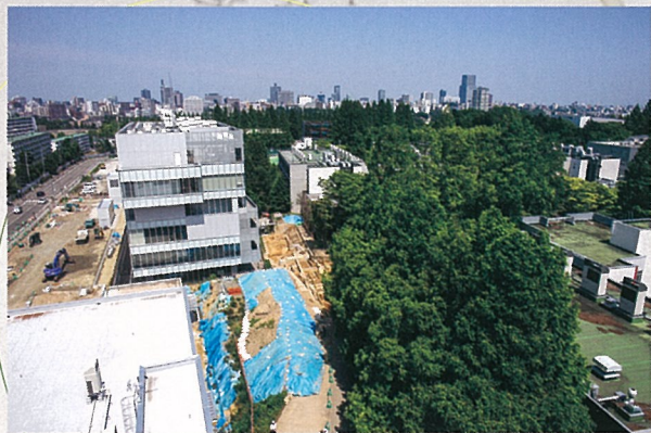
川内キャンパス発掘調査(ドローン)(2021年12月)