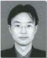
地域環境研究部門資源環境学研究分野助手

日本館開設から7年の間に様々な国との交流を持ち、変化を続けているノボシビルスク（特にロシア科学アカデミーシベリア支部）は、ロシアが目指すハイテク経済のための戦略的地域として今後益々ヨーロッパやアジアから脚光を浴びることになるのは必至です。ロシアの科学技術についての情報収集は今後もちろん優先的に行っていきたいと考えておりますが、ロシアにはすぐ使える技術が少ないという見方もあってか日本ではあまり話題にならないシベリアについて、日本館での活動を通じ、競ってこの地に入り込もうとする他国の動きやロシア側の思惑、将来の展望などについても注意を払いロシア科学技術と併せて考えていくことで今までより一歩踏み込んだ見地で理解を深められるように努力していきたいと思えます。