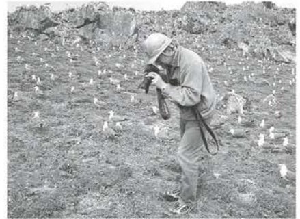
繁殖コロニーの調査風景